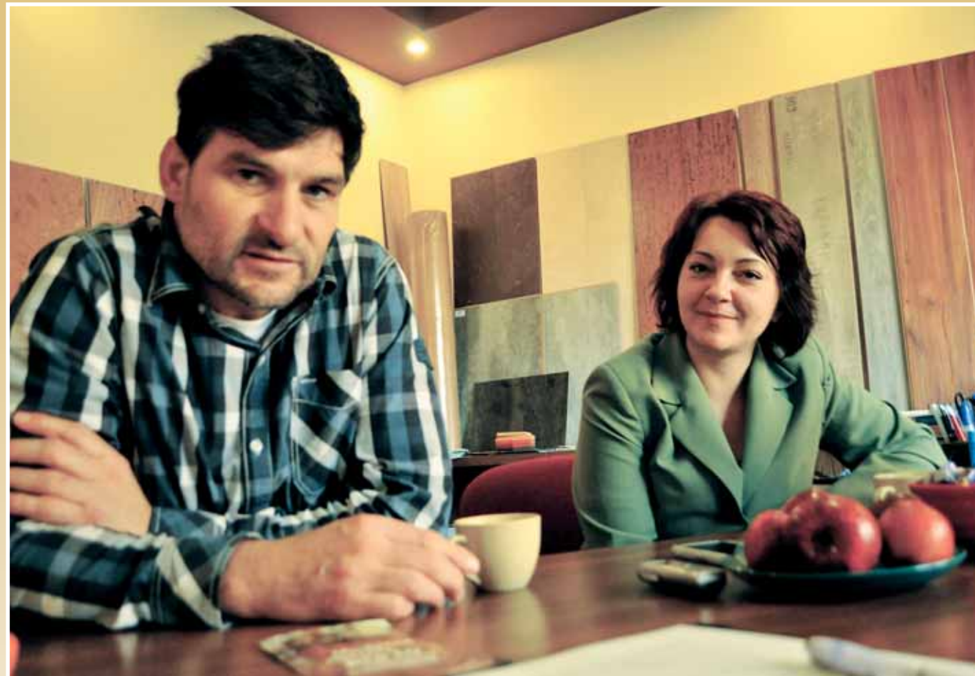
Odborníkov na korok zo spoločnosti Trems korok očaril svojou originalitou. „Oslovila nás kvalita. Korok nie je obyčajný sortiment v porovnaní napríklad s laminátmi, ktorých je na trhu mnoho, korok je kvalitný a výnimočný produkt.“