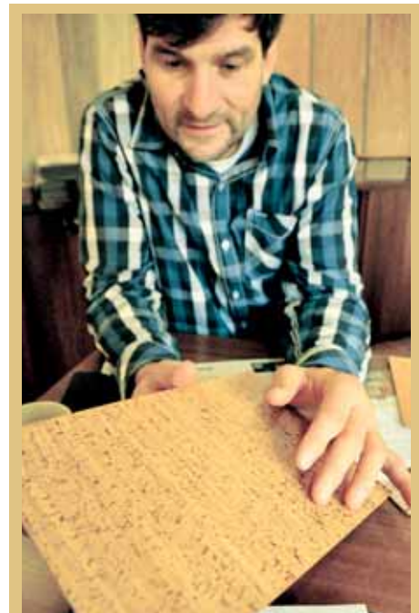
Výsledná textúra korku vzniká technikou prekladaní, lámání a lisování různých vstiev kôry korkového duba

Jeho zložkami sú suberín (pôsobí ako prírodný repelent – odpudzuje hmyz) a vosk, ktoré neprepúšťajú tekutiny ani plyn, preto korok ani po stáročia nevytlačilo z vinárstva nič iné.